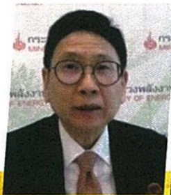
กฤษ สมบัติศรี ปลัดกระทรวงพลังงาน